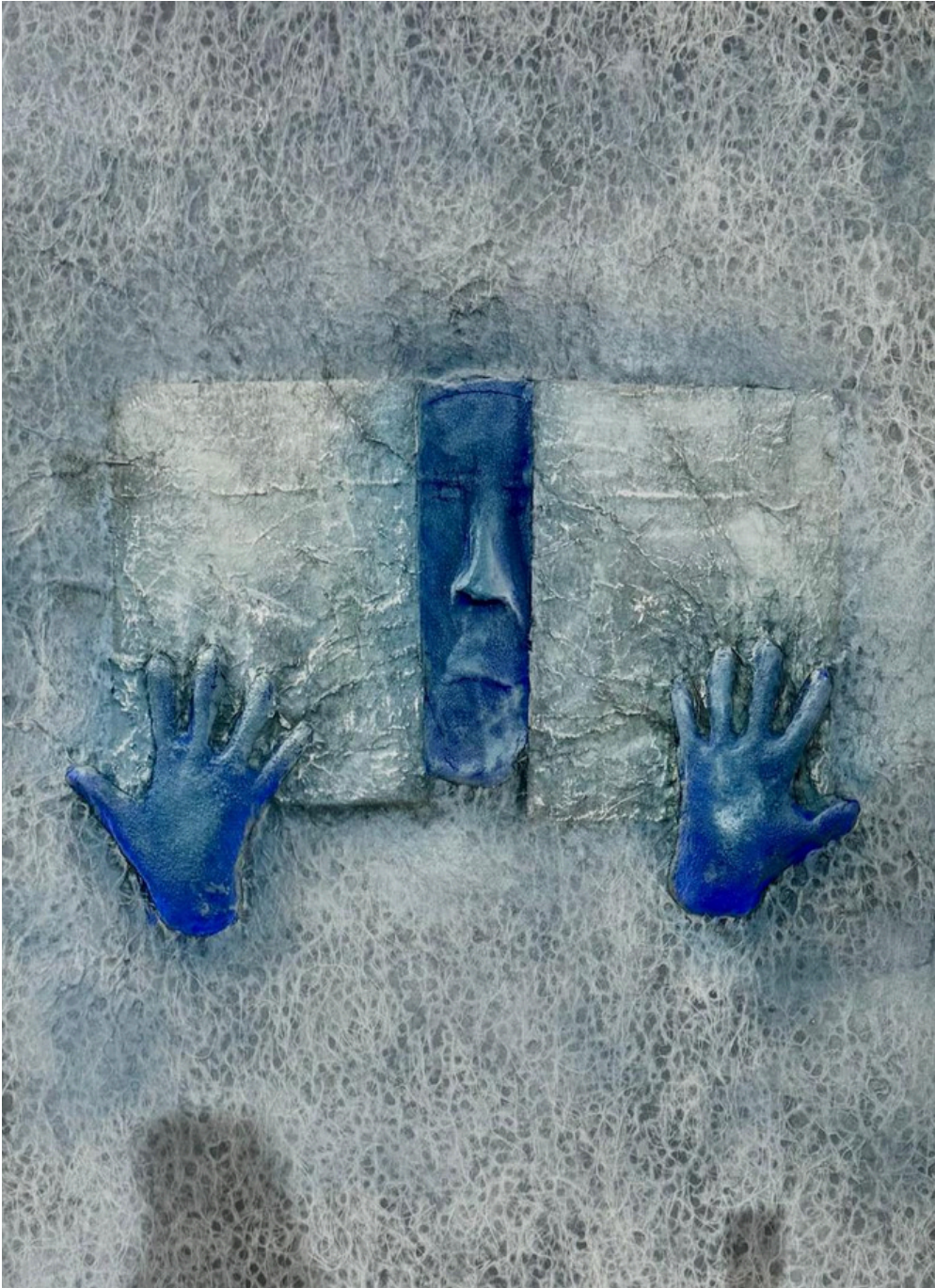
PEINTURE DE MAHI BINEBINE