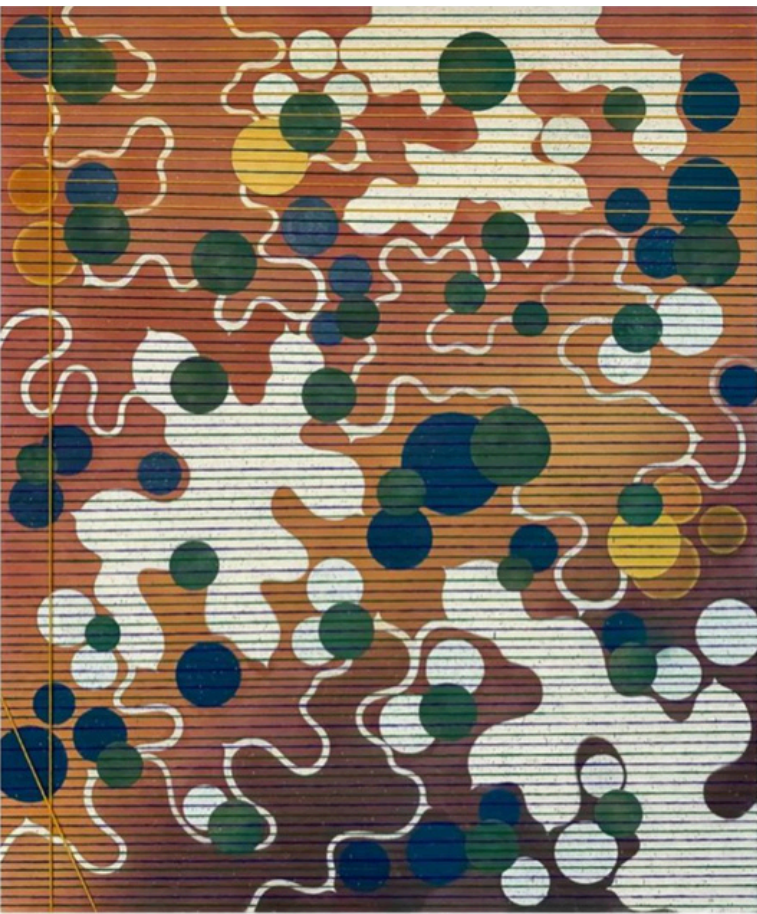
INÈS-NOOR CHAQROUN - TECHNIQUES MIXTES SUR TOILE