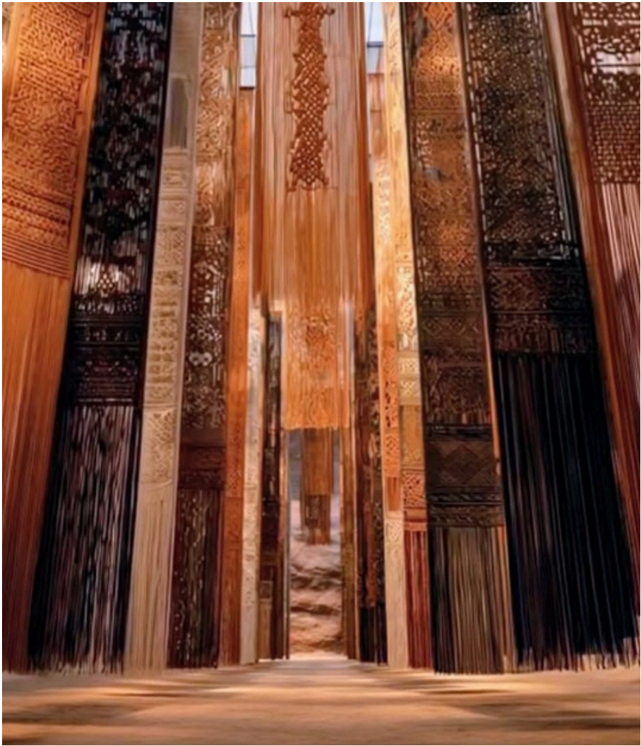
EXEMPLE D'INSTALLATION - SOUMIYA JALAL