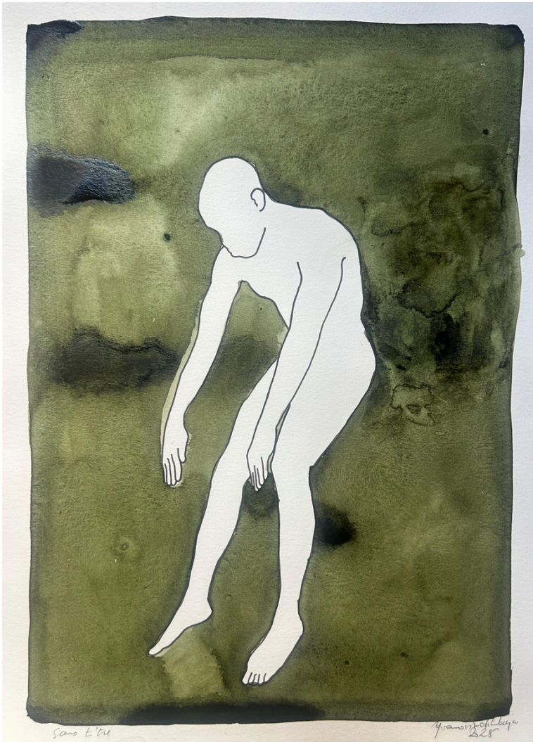
YVANOVITCH MBAYA - CAFÉ, PIGMENT INDIGO ET ENCRE DE CHINE SUR PAPIER ARCHES