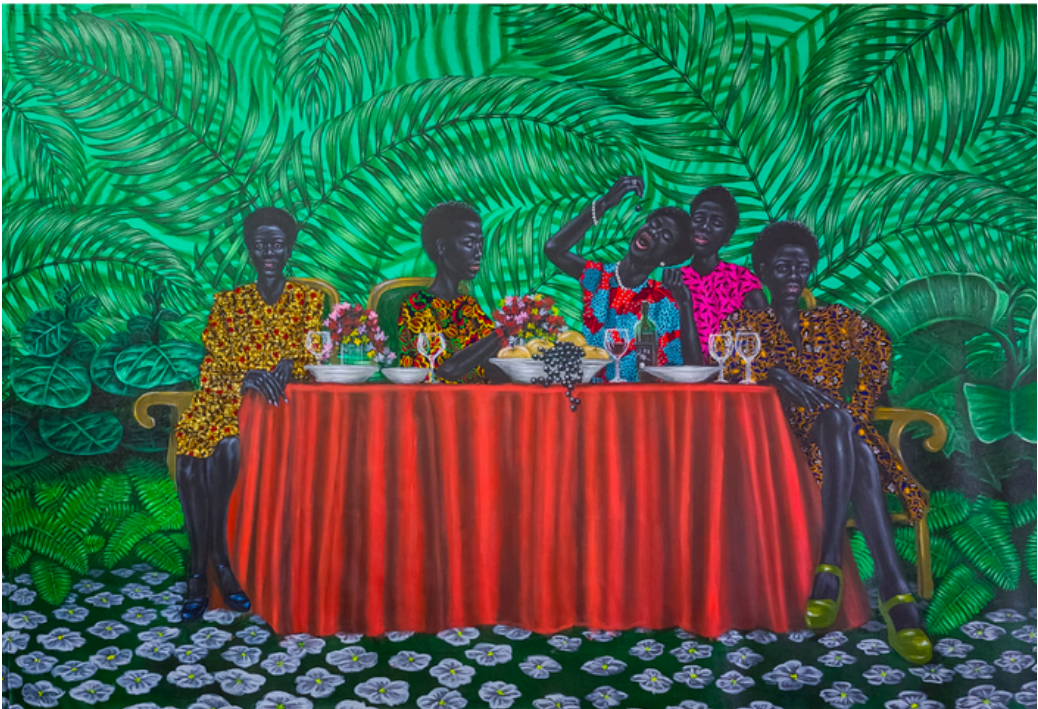
PEINTURE DE REGGIE KHUMALO