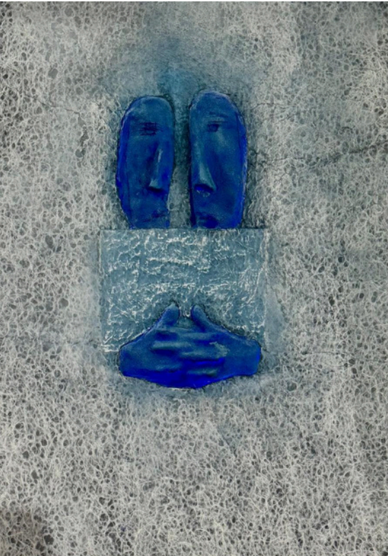
PEINTURE DE MAHI BINEBINE

Le vernissage de l’exposition "la Mémoire des Gestes" s'inscrit dans le parcours VIP de la foire 1-54 et se tiendra quant à lui au M.O Studio du Mandarin Oriental, Marrakech.