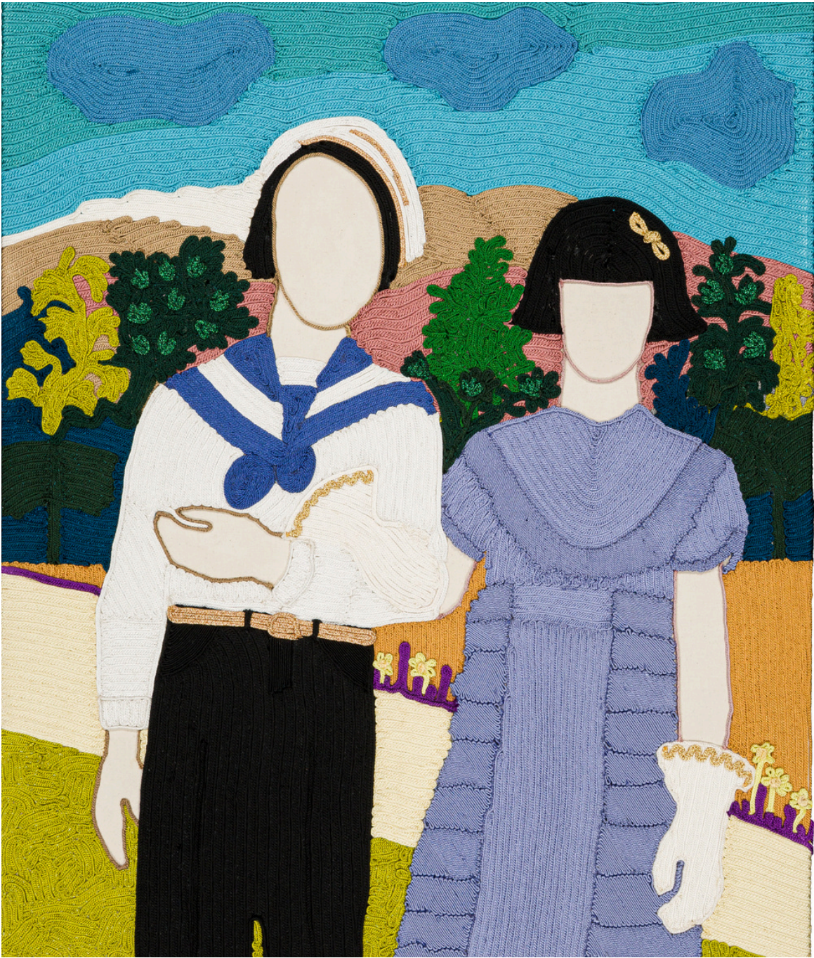
MARGAUX DERHY - PASSEMENTERIE SFIFFA BRODÉE À LA MAIN SUR COTON