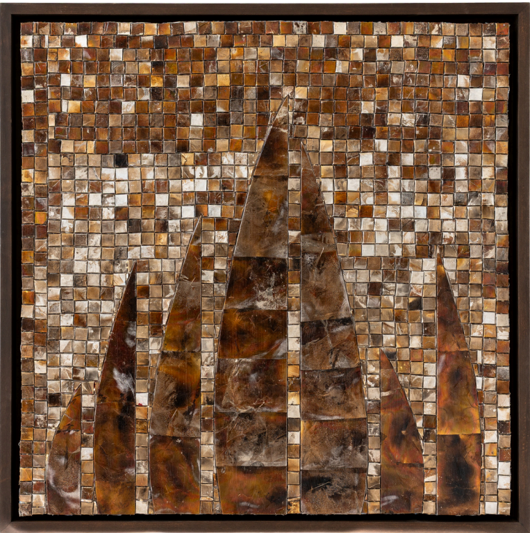
LOUTFI SOUIDI - ALUMINIUM SUR TOILE