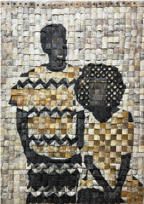
ENOCH NII AMON HAMMOND - CORNE DE VACHE ET FIL DE PÊCHE